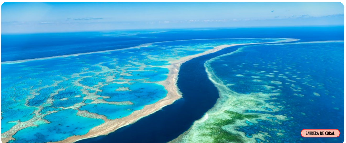
BARRERA DE CORAL